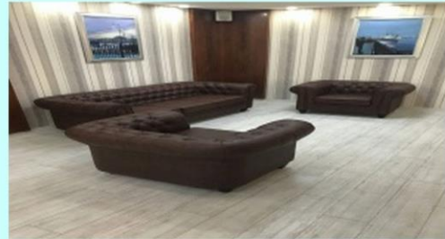
BURSA MURADIYE UYGULAMA OTELİ