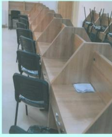
ALTINOVA DENİZCİLİK MESLEK LİSESİ