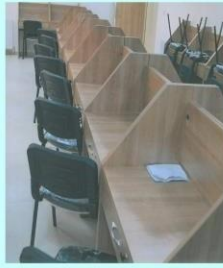
ALTINOVA DENİZCİLİK MESLEK LİSESİ